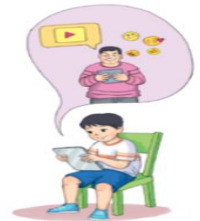
Hình 9. Kẻ xấu dụ dỗ

– Lãng phí thời gian: Cố tình truy cập vào những trang web không phù hợp lứa tuổi và không nên xem, em bị mất đi thời gian quý báu cho học tập và những hoạt động bổ ích khác.