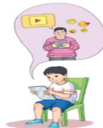
Hình 9. Kẻ xấu dụ dỗ

– Bị lừa đảo, dụ dỗ, bắt nạt: Kẻ xấu có thể gửi các tin nhắn mạo danh, nặc danh qua các trang web để đe dọa và làm tổn thương em hoặc dụ dỗ em làm điều xấu.