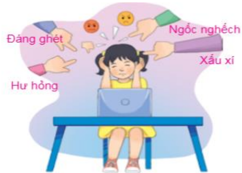
Hình 8. Tình huống An gặp phải

An gặp rắc rối: bị mọi người phê phán, chỉ trích về ngoại hình, tính cách.