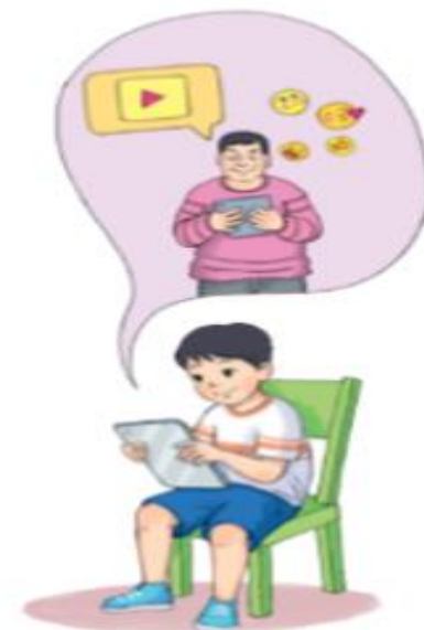
Hình 9. Kê xấu dụ dỗ

– Có những suy nghĩ tiêu cực và lệch lạc: Xem thông tin không phù hợp với lứa tuổi khiến các em không hiểu hết hoặc hiểu một cách lệch lạc ảnh hưởng đến suy nghĩ và nhận thức của các em.