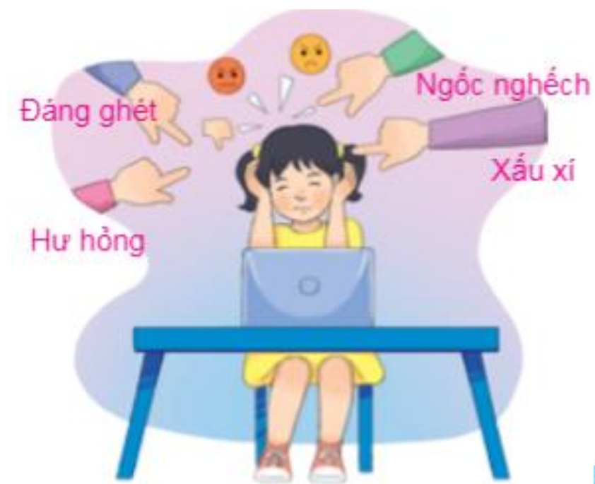
Hình 8. Tình huống An gặp phải

Trong khi truy cập Internet, bạn An vô tình vào một trang web trò chuyện không phù hợp. Em hãy quan sát Hình 8 và cho biết bạn An đã gặp rắc rối gì?