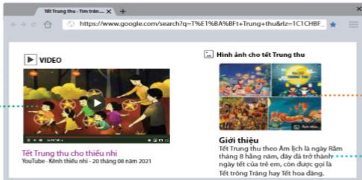
Hình 7. Thông tin trên trang web

Em hãy quan sát trang web ở Hình 7 và cho biết các vị trí được đánh số thể hiện thông tin thuộc dạng nào ?